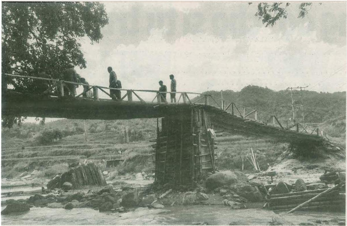
Cây cầu mới bắc qua suối Yên dẫn được hình thành.