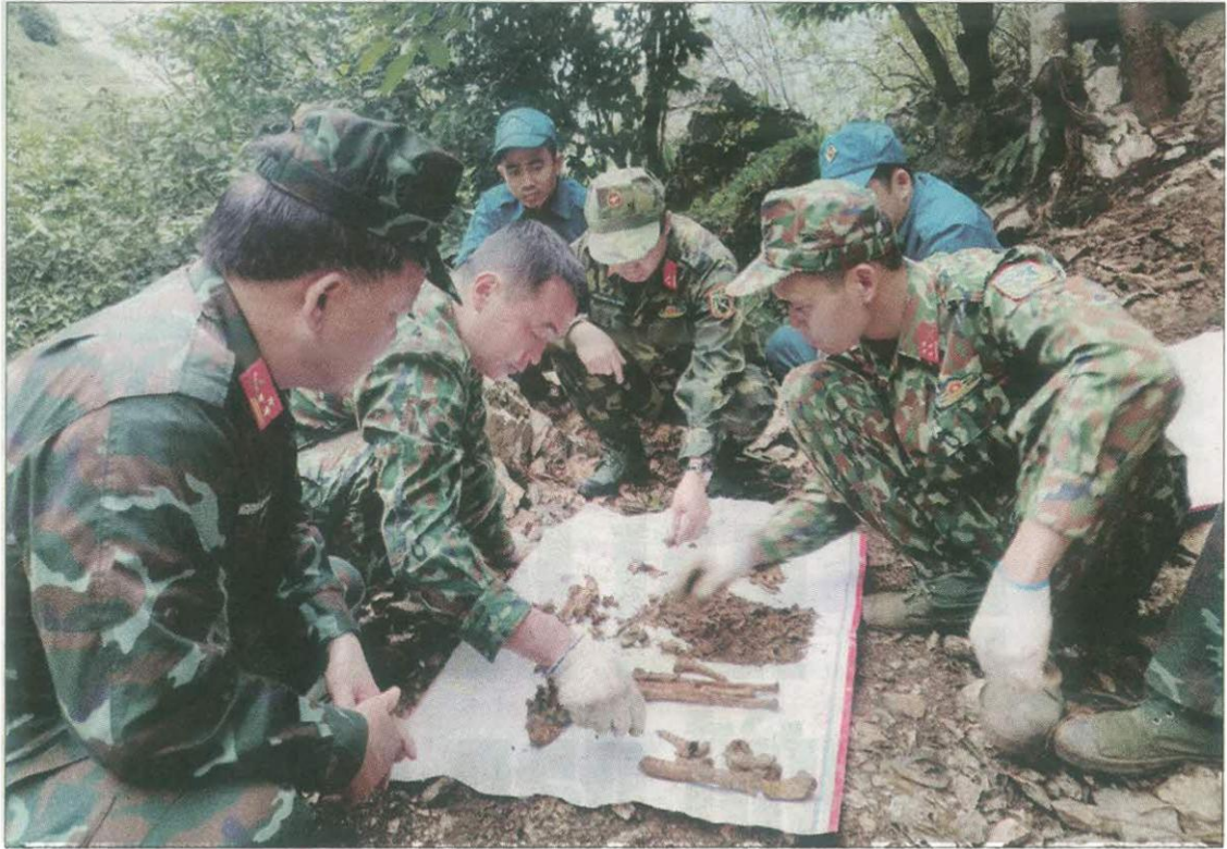
Đội tìm kiếm quy tập hài cốt liệt sĩ, Bộ Chỉ huy quân sự cất bốc hài cốt liệt sĩ trên điểm cao 211 thôn Giang Nam, xã Thanh Thủy (Vị Xuyên, Tuyên Quang).

với khoảng 7.126 phần mộ liệt sĩ chưa xác định thông tin tại các nghĩa trang liệt sĩ và các hài cốt liệt sĩ mới được quy tập.