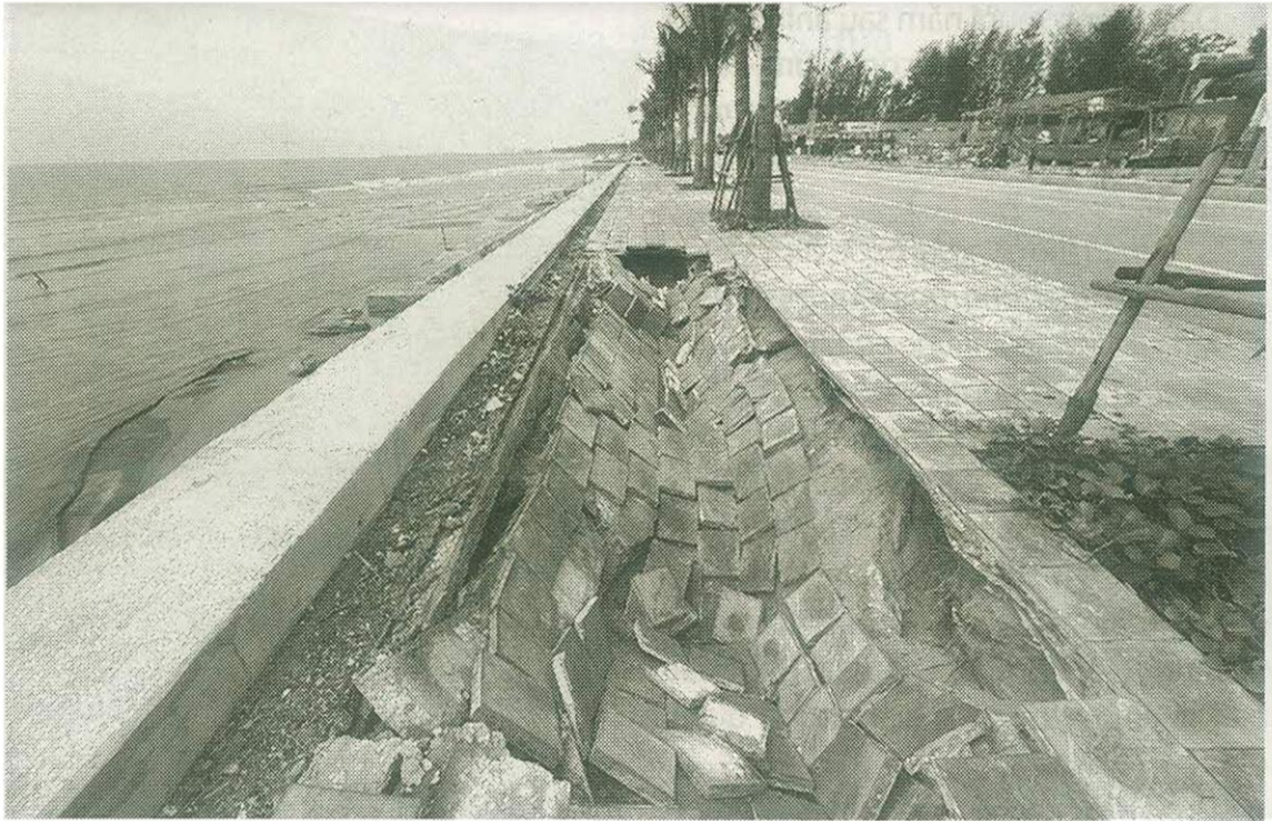
Độc bờ kè biển đoạn từ kênh Phúc Ngư đến thôn Giang Sơn bị sụt lún nghiêm trọng.

Đơn vị thi công đã tổ chức khắc phục tình trạng sạt mái kè sau mùa mưa bão, từ tháng 11-2025 đến tháng 3-2026. Tuy nhiên, đến nay tình trạng sạt lở vẫn tiếp diễn, có nguy cơ lan rộng và diễn biến phức tạp. Ghi nhận tại hiện trường cho thấy bãi cát dọc chân kè bị xói lở, mất cát với độ sâu từ 1,8-2,2m. Phần vỉa hè phía sau tường kè bị sụt lún tại 5 vị trí, với tổng chiều dài gần 200m, độ sâu trung bình khoảng 2,6m, rộng từ 3,5-5m, tiềm ẩn nguy cơ mất an toàn cho người dân và du khách.