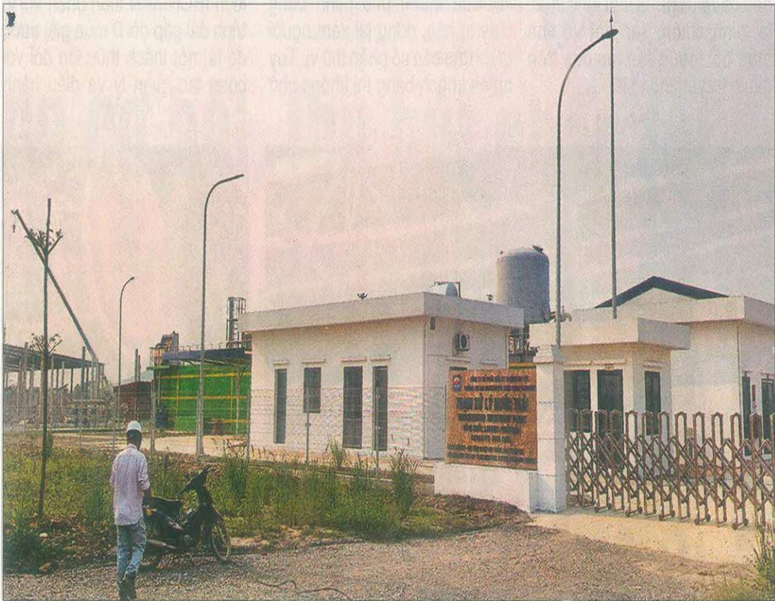
Trạm xử lý nước thải ở Cụm công nghiệp Hợp Thới được cơ quan chức năng Thanh Hóa kiểm tra, cấp phép vận hành.

dân và doanh nghiệp. Theo đó, thời gian chấp thuận chủ trương đầu tư giảm 30%; cấp giấy phép quy hoạch giảm 51%; cấp giấy phép xây dựng giảm 50%; giao đất, cho thuê đất giảm 40%. Các dự án trọng điểm được phân luồng, xử lý theo cơ chế “làn xanh”, rút ngắn 50%-60% thời gian giải quyết so với quy định.