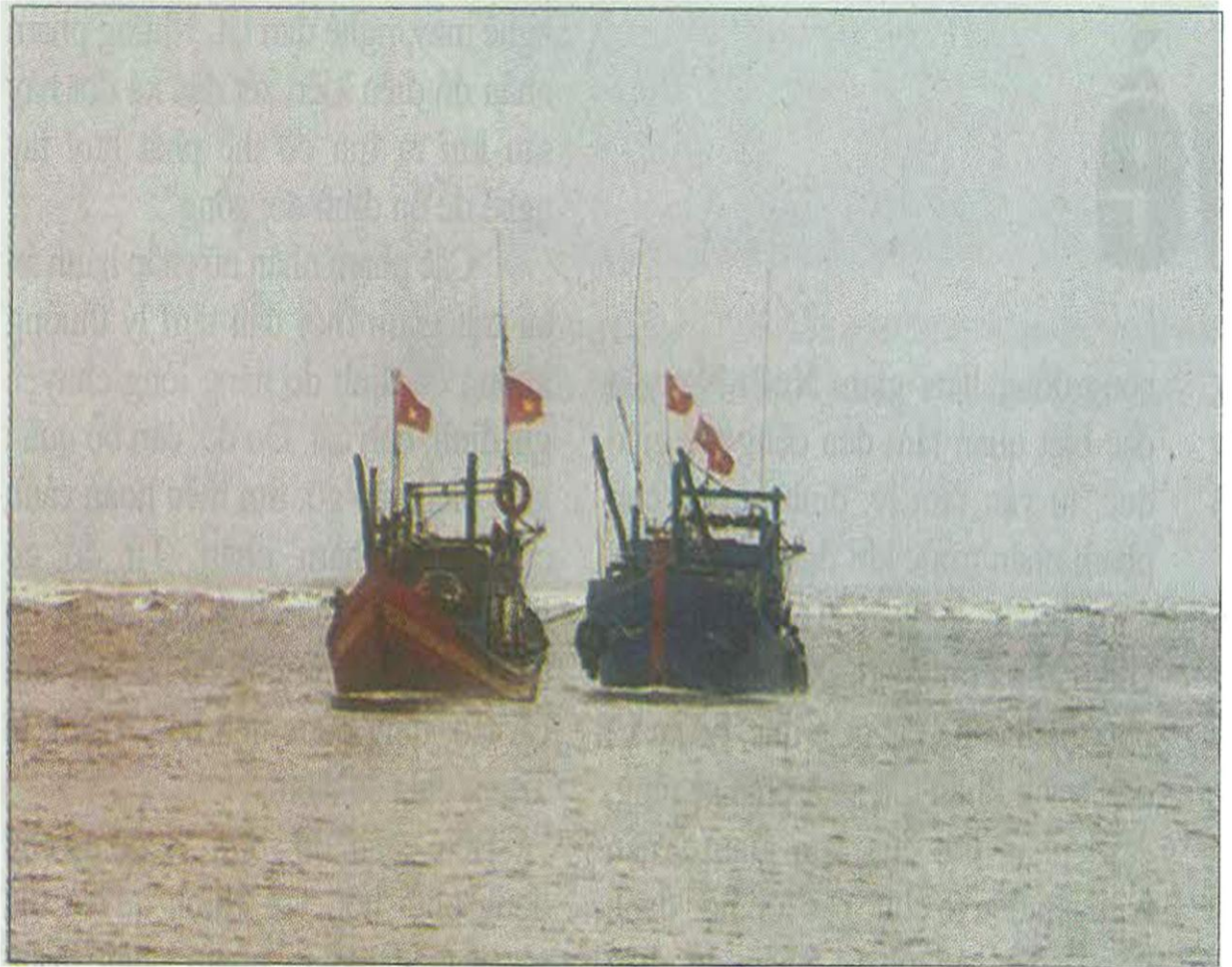
Lai dất tàu bị cuốn trôi vào bờ.