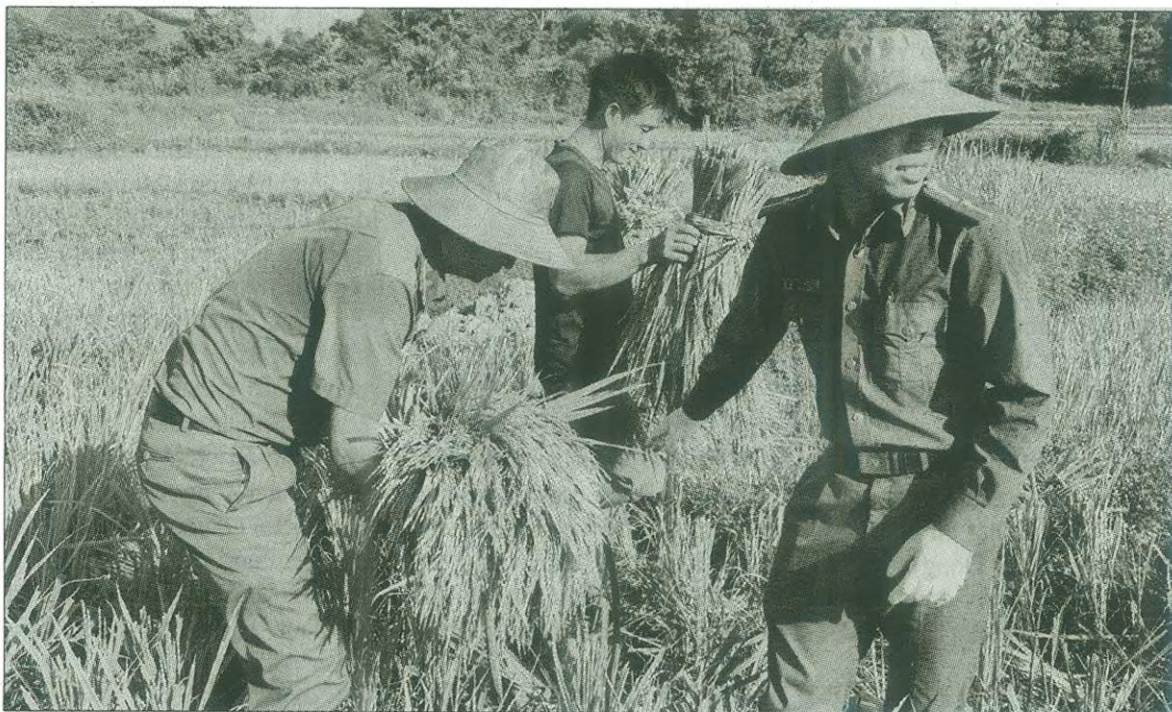
Công an xã Thanh Quân huy động hàng chục lượt CBCS giúp người dân trên địa bàn thu hoạch lúa.

lực, có hoàn cảnh khó khăn được lực lượng Công an giúp gặt lúa, tuốt lúa, vận chuyển và đưa thóc về nơi tập kết.